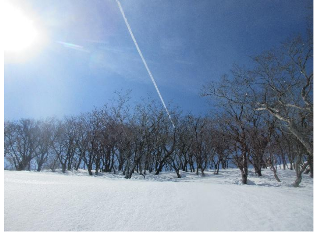
テーブルランド、飛行機雲が鮮やかだ