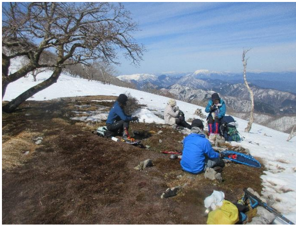
ポタンブチでの昼食休憩、奥には霊仙と伊吹山