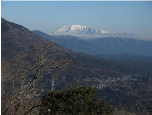
第二鉄塔からの伊吹山

■ 今回で3回目の挑戦となる積雪期の御池岳テーブルランドの青のドリーネ、2年前は雨で当日に急遽行先変更、去年は真ノ谷でのテント泊まででテーブルランドはガスと風のため撤退、ようやく今年は天候に恵まれて御池岳こそ行かなかったがテーブルランドを周回して青のドリーネ(なぜ青をつけるのか不明)を堪能することができた。金曜日の夜に奈良を出発し四日市の温浴施設で一泊、翌朝藤原パーキングで準備を済ませて出発。他にもたくさんの登山者の車が停まっていた。予定コースは木和田尾から白瀬峠(標高約1000m)を越えまっすぐ真ノ谷(標高約840m)に下りテーブルランド(標高約1170m)までの急斜面の直登、テーブルランドと御池岳を巡り下山の計画だ。雪は中腹あたりから現れて第二鉄塔あたりから徐々に雪道になる。先行者のトレースがしっかりあるのだが、今日は比較的气温が高めで踏み抜きの後も随所にみられる。藤原岳への分岐からしばらくはトラバースのルートで、そこを過ぎると約100mの急登で白瀬峠に到着。目の前にテーブルランドの急斜面が広がる。白瀬峠からはトレースを拾い真ノ谷へ標高差約150mを下る。そして急斜面の登り返し300mはほぼ直登できつい。約1時間の登りでテーブルランドの縁にようやくたどり着くとボタンブチの方に移動、遠く白山や御嶽、中央アルプス?も霞んで見えている。昼食休憩後、御池岳はやめてテーブルランドを周回、随所にあるドリーネを回り下山開始。真ノ谷までの下りは踏み抜きに時間を要し汗だくになる。その後はまた白瀬峠までの登り返しを経て、約2時間で駐車場に帰り着いた。天候に恵まれてしっかり雪焼けもしてしまったが楽しい山行だった。