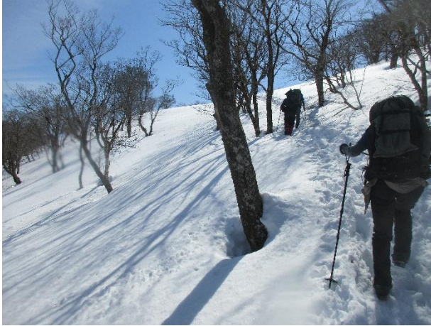
急登をおえてテーブルランドへ