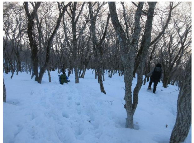
テーブルランドの下り、踏み抜きに遅々として進まず