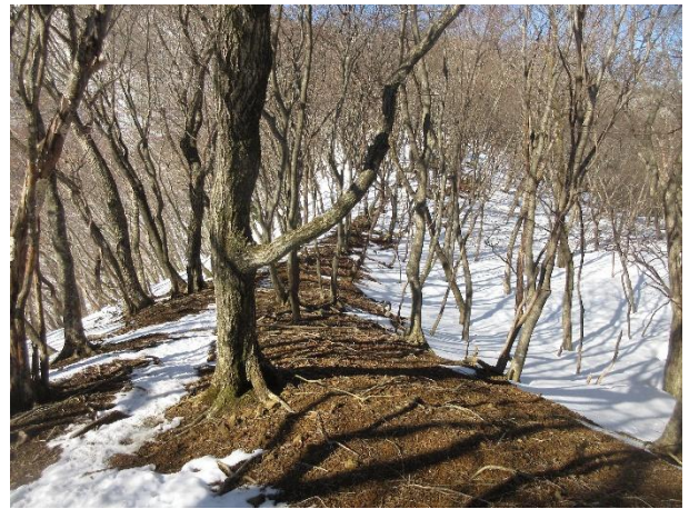
中腹の尾根路、明るく暖かい