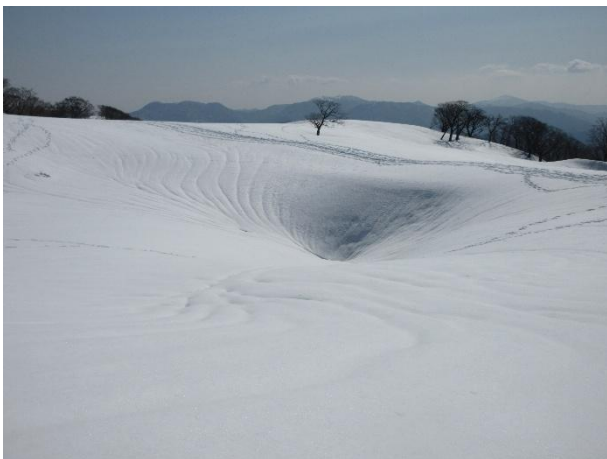
テーブルランドのドリーネ 2