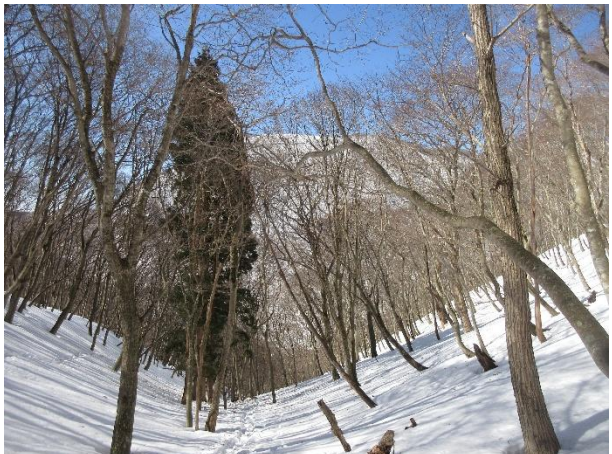
白瀬峠から真ノ谷へ、最初は緩やかだが・・・