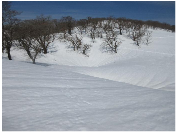
テーブルランドのドリーネ 1